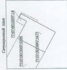
Координаты границ земельного участка