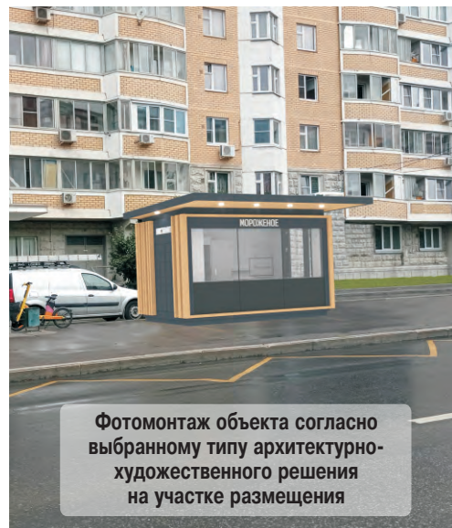
Фотомонтаж объекта согласно выбранному типу архитектурно-художественного решения на участке размещения