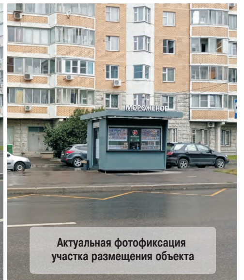
Актуальная фотофиксация участка размещения объекта