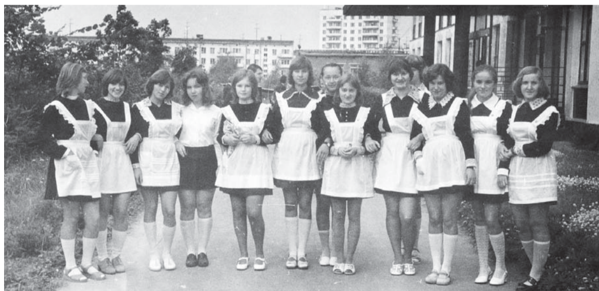
Первое сентября 1970 года