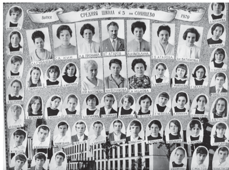
Первый выпуск школы № 5