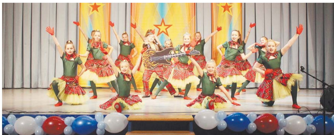
Эстрадно-спортивный ансамбль «Непоседы-Данс»