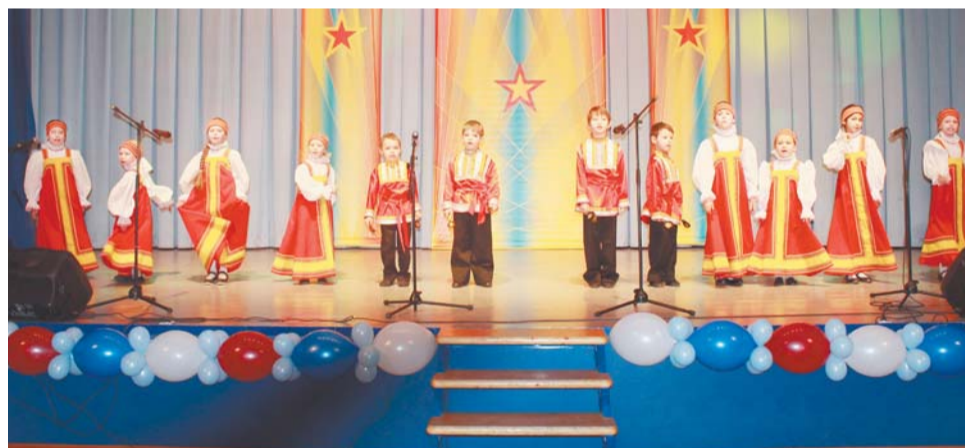
Фольклорная студия «Родничок»