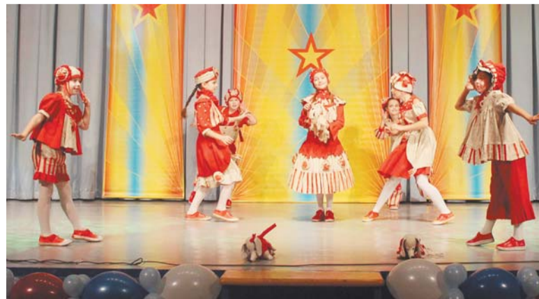
Ведущий творческий коллектив города Москвы «Театр моды Ассоль»