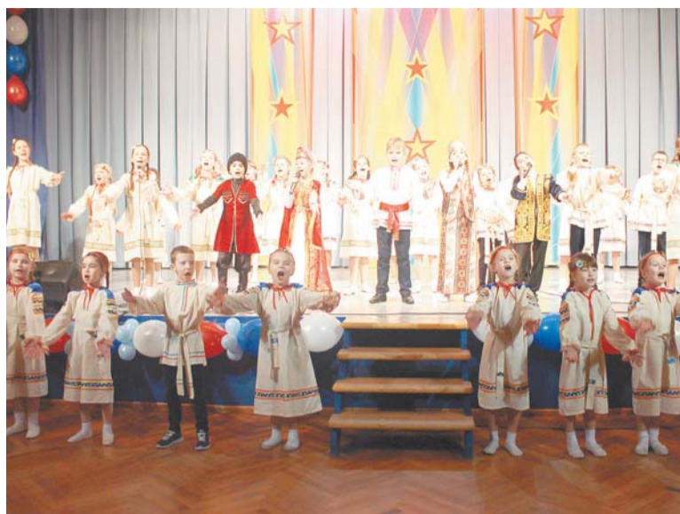
Эстрадный хор «Веселые нотки»