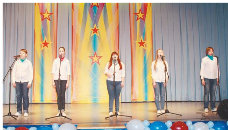
Вокальный ансамбль «Звездный путь»