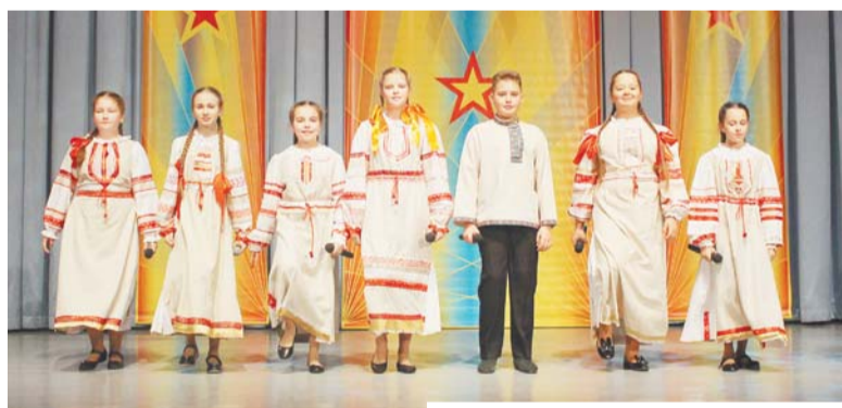
Учащиеся ГБОУ «Школа №1542», эстрадный ансамбль «Карусель мелодий»