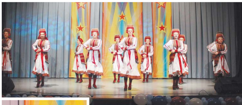
Детский хореографический коллектив «Солнцецвет»