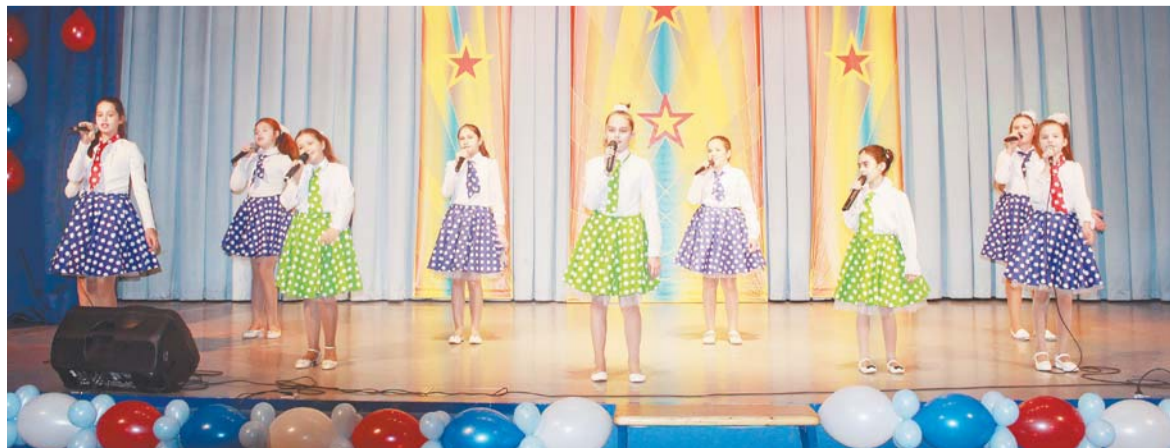
Младшая группа детского образцового коллектива студии «Звуки музыки»