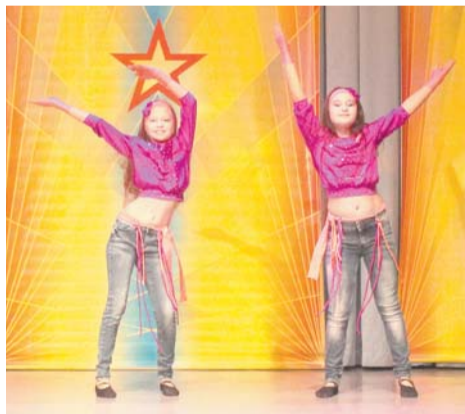
Студия восточного танца «Нефертити»