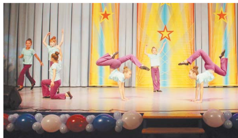
Студия современного эстрадного танца «Журавлик»