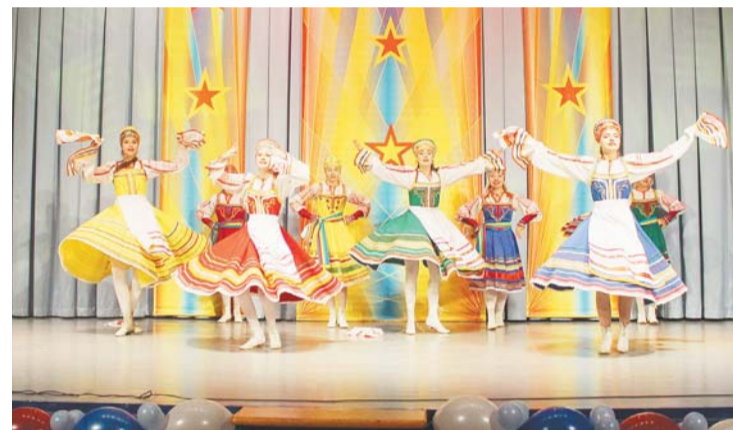
Эстрадно-спортивный ансамбль «Эври-Данс»