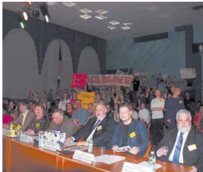
Жюри конкурса «Мисс Солнцево–2016»

Каждый год подростки и молодежь района неотрывно следят за подготовкой и проведением «Мисс Солнцево», становясь соучастниками и свидетелями самого яркого молодежного конкурса года. А после финала еще несколько месяцев обсуждают в социальных сетях итоги проекта, делятся фотографиями, видеороликами и комментариями.