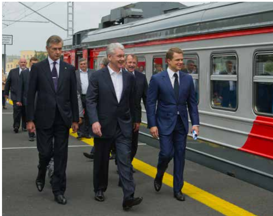
Сергею Собянину удалось запустить и начать реализовывать новые программы развития практически по всем направлениям городской политики

— Если вы посмотрите в адресную инвестиционную программу Москвы (это документ, где сконцентрированы все капитальные затраты), то вы увидите, что подавляющая часть этих затрат — это развитие транспортной сети: строительство автомобильных дорог, метрополитена, строительство совместно с РЖД, реконструкция пригородных электричек, закупка нового подвижного состава и т.д. Все основные ресурсы города, а не только Департамента транспорта, направлены именно на решение этой проблемы, — заявил однажды в одном из интервью Сергей Собянин. По его словам, если решать проблему только за счет строительства новых дорог, ничего не получится. Но решать ее надо, тем более что количество пассажи-