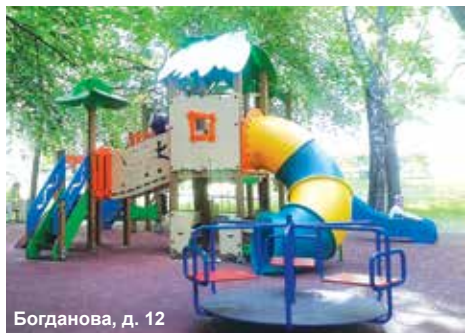
Богданова, д. 12

Мы обратили внимание лишь на некоторые проекты и программы приведенные к жизни командой Мэра Москвы Сергея Собянина за время его работы на посту градоначальника. Отдельного разговора, на наш взгляд, заслуживают первые плоды реформирования таких жизненно важных сфер как социальное обеспечение, культура, здравоохранение, образование, где уже получены положительные результаты и обозначились позитивные тенденции.