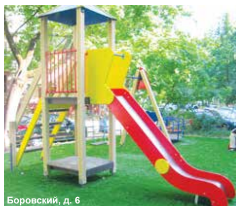
Боровский, д. 6