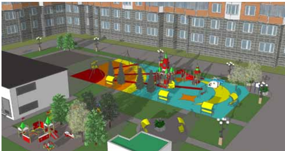
Проект межквартирного городка