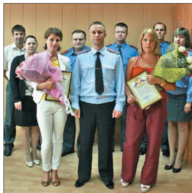
ФОТО НА ПАМЯТЬ — ГЕРОИНИ ДНЯ ВМЕСТЕ С НАЧАЛЬНИКОМ И СОТРУДНИКАМИ ОТДЕЛА МВД ПО РАЙОНУ СОЛНЦЕВО