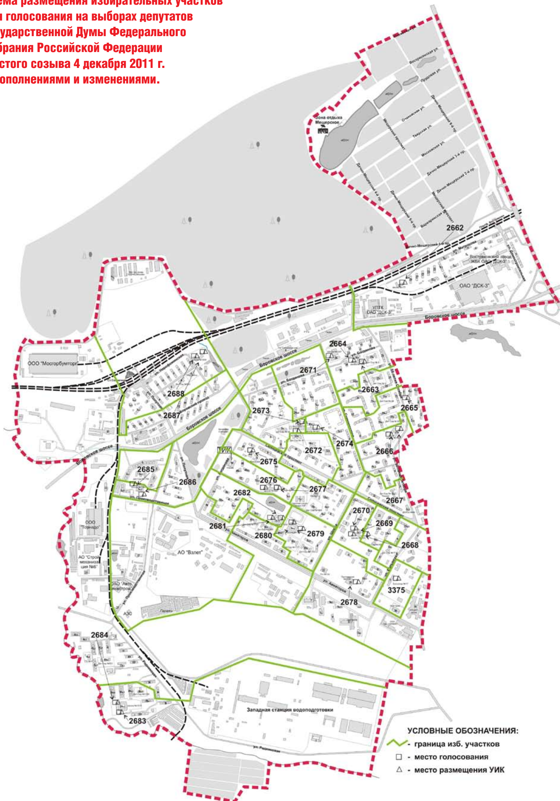
Схема размещения избирательных участков для голосования на выборах депутатов Государственной Думы Федерального собрания Российской Федерации шестого созыва 4 декабря 2011 г. с дополнениями и изменениями.