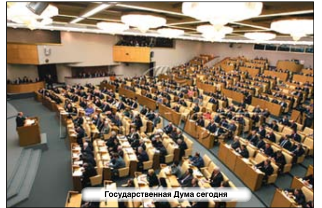
Государственная Дума сегодня

в год, рассматривал законопроекты и утверждал указы своего Президиума.