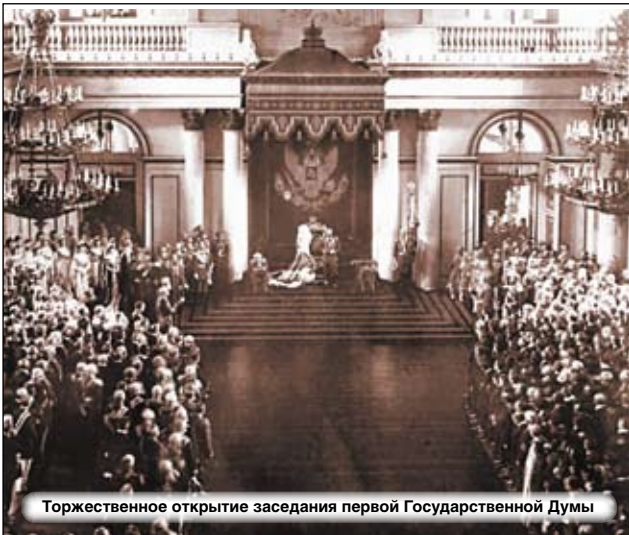
Торжественное открытие заседания первой Государственной Думы