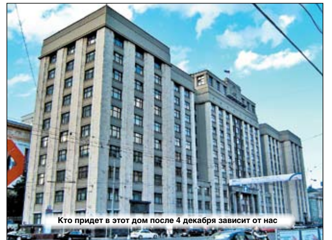
Кто придет в этот дом после 4 декабря зависит от нас

5 декабря 1936 г. VIII Всесоюзный съезд Советов принял новую Конституцию СССР. Она вводила всеобщие, прямые и равные выборы при тайном голосовании. На смену съездам Советов и ЦИКУ пришел Верховный Совет СССР. Он также собирался на сессии два раза