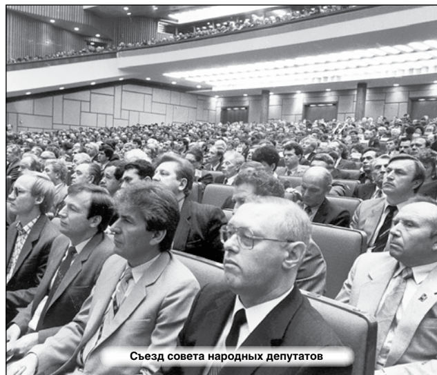
Съезд совета народных депутатов

Сегодня Государственная Дума состоит из 450 депутатов (ст. 95 Конституции РФ). С 2007 г. депутаты Государственной Думы избираются по пропорциональной системе, то есть по партийным спискам. Проходной барьер для партий составляет 7%. Срок полномочий депутатов Государственной Думы, избранных в декабре 2011 года, увеличен до 5 лет.