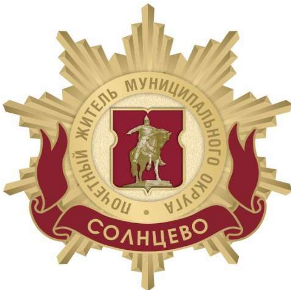
Рисунок нагрудного знака к званию «Почетный житель внутригородского муниципального образования – муниципального округа Солнцево в городе Москве»

Приложение 3 к решению Совета депутатов внутригородского муниципального образования – муниципального округа Солнцево в городе Москве от _____ 20__ года № _____