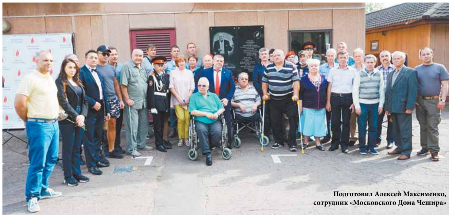
Подготовил Алексей Максименко, сотрудник «Московского Дома Чешира»